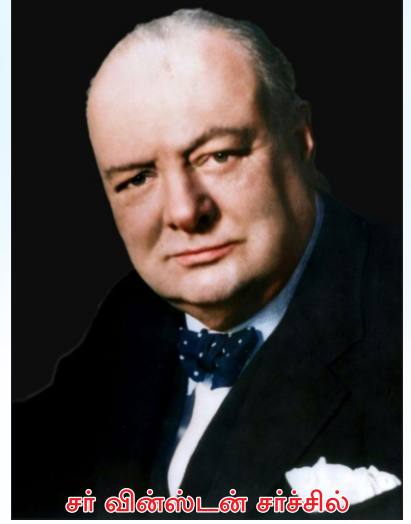
சர் வின்ஸ்டன் சர்ச்சில்

இதுதான் காலத்தால் செய்த உதவி என்பதாகும்.